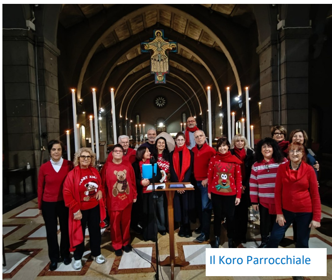
Il Koro Parrocchiale