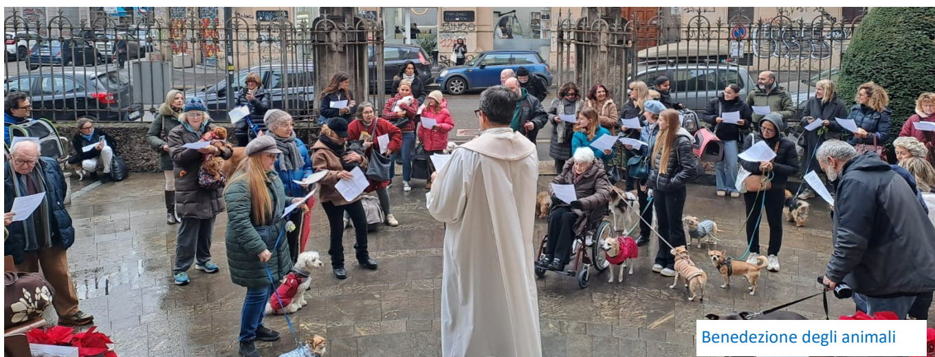
Benedizione degli animali