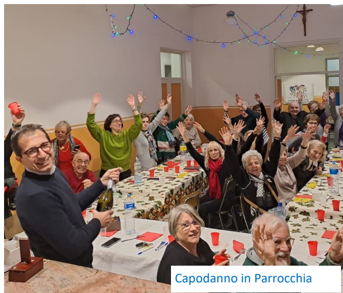
Capodanno in Parrocchia